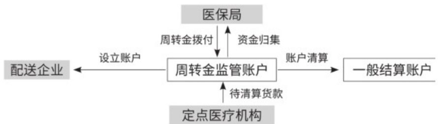
图1 张家口市药品集采周转金监管系统对接图

每月19日至22日，配送企业与定点医疗机构在周转金系统中进行本月对账，核对上月20日至本月18日的